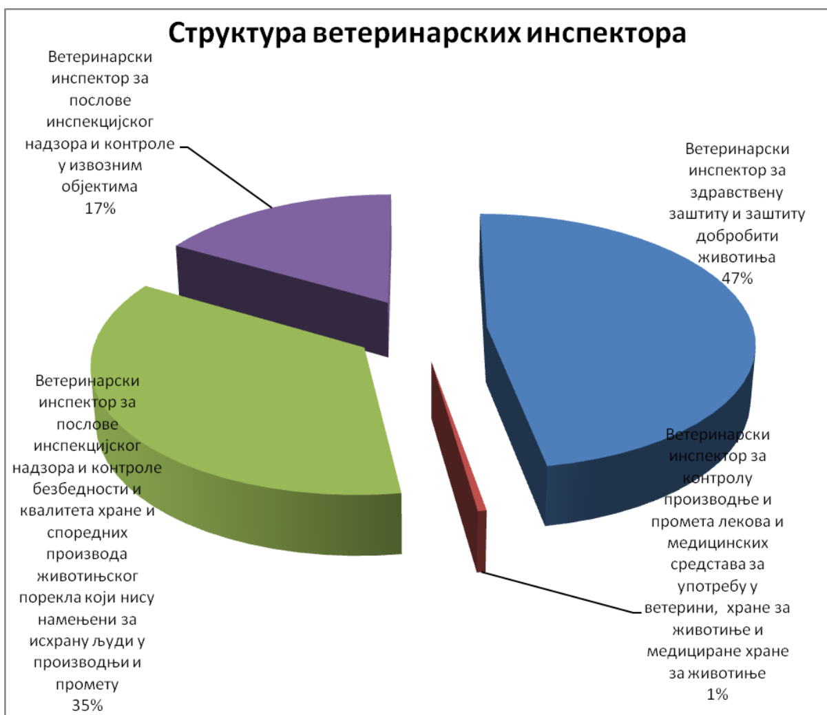
Табела 3. – Структура ветеринарских инспектора исказана процентуално